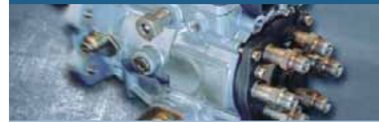
Dízel részegység-vizsgálat EPS