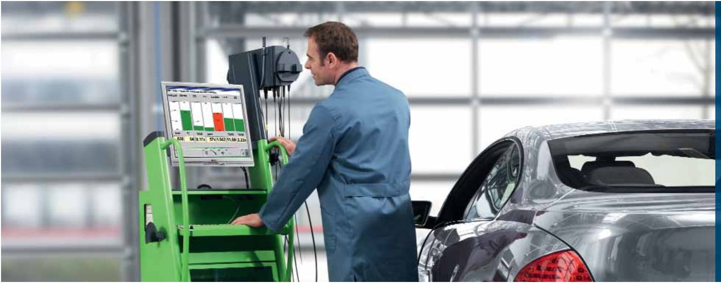
Emissziómérés BEA 850-nel

A károsanyag-kibocsátás vizsgálata és minimumra csökkentése moduláris méréstechnológiával – a legújabb törvényi előírások szerint és a legnagyobb mérési pontossággal. A műhelynek ahhoz, hogy mindezt elérje, tartós, a jövő technológiáit befogadni képes készülékekre van szüksége, egyértelmű felhasználói utasításokkal és kezelőfelülettel. A Bosch emisszióvizsgáló berendezések könnyű és időtakarékos kezelésükkel tűnnek ki. További, különösen fontos szempont a kipufogógáz-elemző gépek mindennapi használata során a gyors beüzemelési és mérési idő.