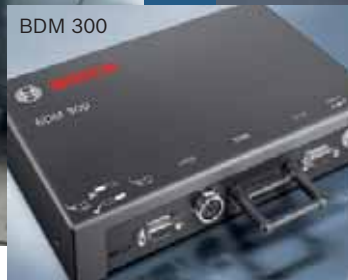
A járművek hatékony emissziómérése